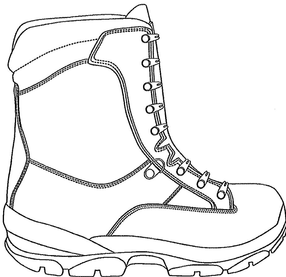
Rys. 1. Trzewik służbowy