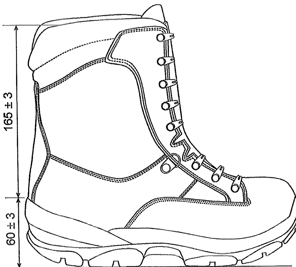
Rys. 3. Wymiarowanie obuwia gotowego (jednostka miary – mm) o numerze 27 według numeracji metrycznej