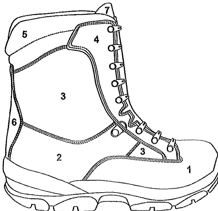
Rys. 2. Trzewiki służbowe - ogólne wymagania konstrukcyjne

Trzewiki powinny zapewniać komfort użytkownikowi: wygodę zakładania i zdejmowania oraz wygodę noszenia podczas wykonywania obowiązków służbowych.